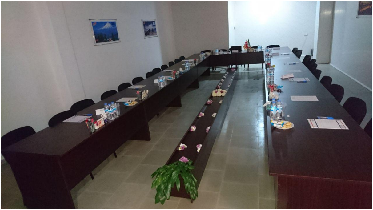
اتاق مدیریت (طبقه زیر همکف)